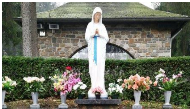
Nuestra Señora de los Pobres - Banneux Bélgica

2. Una oveja vuelve a la casa: ¡Qué alegría para los que la han apoyado a lo largo de los días con sus atenciones y oraciones! Es la alegría del cielo y de la tierra la que estalla. Esta alegría no podemos hacer otra cosa que compartirla con los que nos rodean cuando volvemos a casa.