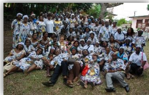
Miembros de los primeros Equipos

Este compromiso en la fe de amar a Dios y hacerle conocer en la esperanza y la caridad, es el fruto de diversos acontecimientos vividos. Y qué vivan los Equipos del Rosario en el mundo entero en la sencillez y la profundidad. Alabado sea Dios.