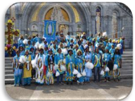
Equipos del Rosario de Gabón en Lourdes en 2012

La segunda particularidad : Gabón ha desarrollado un movimiento de espiritualidad dominica sin una presencia de la Orden en Gabón, mientras que los países fronterizos disponen de conventos y de casas dominicanas. El establecimiento de la organización se ha desplegado a la sombra y a medida del progreso del Movimiento: Responsable de Equipo, responsable de Sector, responsable Diocesano y Nacional. Todas las diócesis tienen capellanes diocesanos nombrados por los diversos obispos de Gabón que cuenta con cinco diócesis. Solamente la diócesis de Franceville no ha integrado totalmente la gran familia de los Equipos del Rosario.