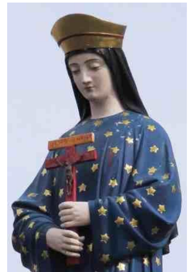
Nuestra Señora de Pontmain Francia