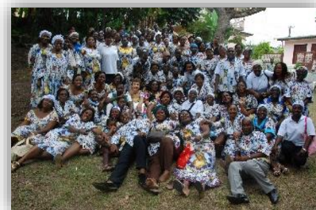
Les équipiers de la 1ère heure

Cet engagement dans la foi à aimer Dieu et à le faire connaître dans l'espérance et la charité est le fruit des divers événements vécus. Et que vivent les Équipes du Rosaire dans le monde entier dans la simplicité et la profondeur. Que Dieu soit loué.