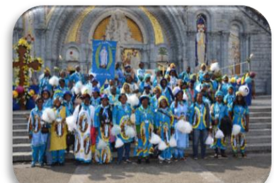
EDR du Gabon à Lourdes en 2012

Un événement . Des 15 équipes paroissiales initiales d'octobre 2001, 7 équipes ont survécu en 2005. La 1ère particularité des EDR du Gabon : les équipes sont mises sous la protection d'un vocable de la Vierge Marie ou d'un saint :